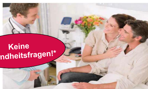
Für Ruhe und Erholung im Krankenhaus

* Für Versicherungsfälle, die vor Abschluss des Versicherungsvertrages eingetreten sind, leisten wir nicht. Davon ist auszugehen, wenn eine Vorsorge- oder Rehabilitationsmaßnahme als mögliche Behandlungsalternative zwischen Arzt und versicherter Person besprochen wurde. Dieses Gespräch muss in den letzten 24 Monaten vor Abschluss des Vertrages anlässlich der Versicherungsfall auslösenden Diagnose(n) erfolgt sein.